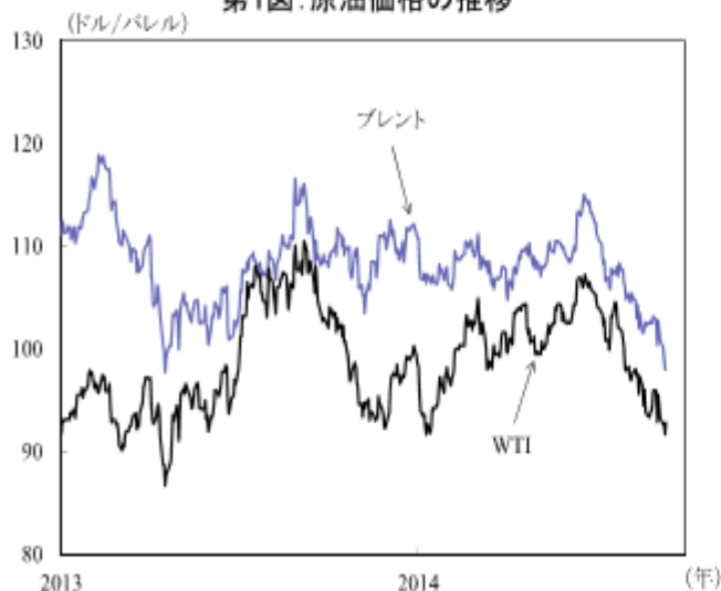
第1図：原油価格の推移

現状では80ドルを切るまで下落しており、それに伴って建玉も26万枚程度まで減少している。ポジション的には70ドル前半でそろそろ落ち着いてくるものと思われる。