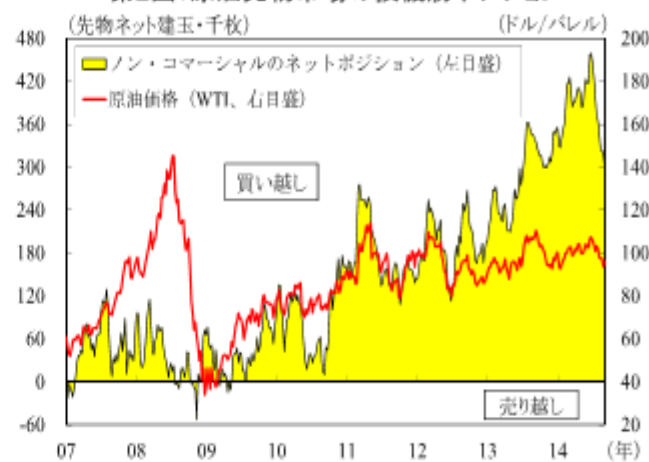
第2図：原油先物市場の投機筋ポジション

(注) ノン・コマーシャルとは、原油生産や精製に従事しない業者のこと、1枚=1,000バレル。 (資料) 米国商品先物取引委員会、ニューヨークマーカンタイル取引所資料より三菱東京UFJ銀行経済調査室作成